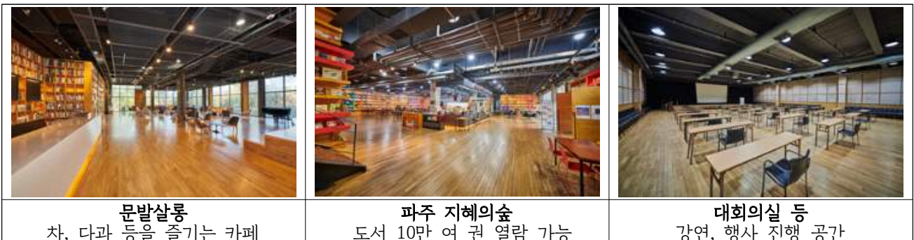
문발살롱 차, 다과 등을 즐기는 카페